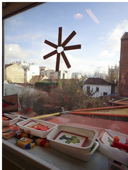
© Ecole maternelle Lamartine, Moyenne Section, Gentilly

Depuis 2021, il travaille sur les terrains d'aventures, des espaces en plein air, libres d'accès et gratuits, prônant l'activité et le jeu libre. Il a effectué en 2024 une résidence au sein de la Villa Dufraine de l'Académie des beaux-arts pour poursuivre ce projet collaboratif.