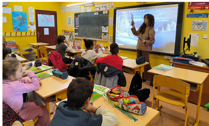
Les coulisses, Photographie à l'école 2025-2026

Les quatre photographes intervenant·e·s ont accompagné les classes dans une exploration visuelle des contrastes : végétation surgissant du béton, mises en scène jouant sur l'ambiguïté entre le sauvage et le construit ou encore sur une hybridation homme-nature. Les élèves ont pu expérimenter différentes approches : balades