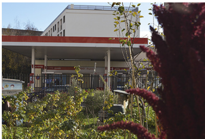
© Lycée Val-de-Bievre, 1 ère Pro Cuisine, Gentilly

Les élèves de moyenne et grande section de