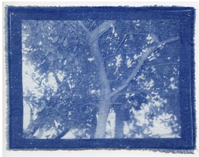
© Ecole maternelle Lamartine, Grande Section, Gentilly

Antoine Bertron est un artiste photographe né en 1998. Diplômé de l'École nationale supérieure Louis-Lumière, il vit et travaille en région parisienne. Il explore dans ses projets les notions d'auto-construction, de lenteur et d'interaction sociale. Il fabrique ses propres appareils photographiques analogiques à partir de matériaux de récupération et d'objets détournés. Il s'intéresse particulièrement à la camera-laboratoire, appareil combinant système de prise de vue et laboratoire argentique noir et blanc dans la lignée des photographes ambulant·es. Il réalise dans l'espace public des portraits qui sont à la fois vecteur et témoin de la rencontre entre le photographe et les modèles. Il explore des alternatives à nos habitudes de consommation de l'image en s'intéressant à d'autres types de matérialités, d'autres moyens de circulations, d'autres modèles économiques comme le troc.