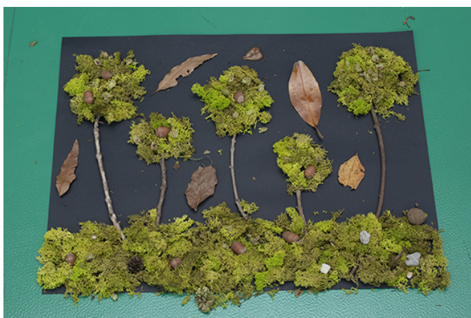
© Ecole élémentaire Simone Veil, CM1, Villejuif