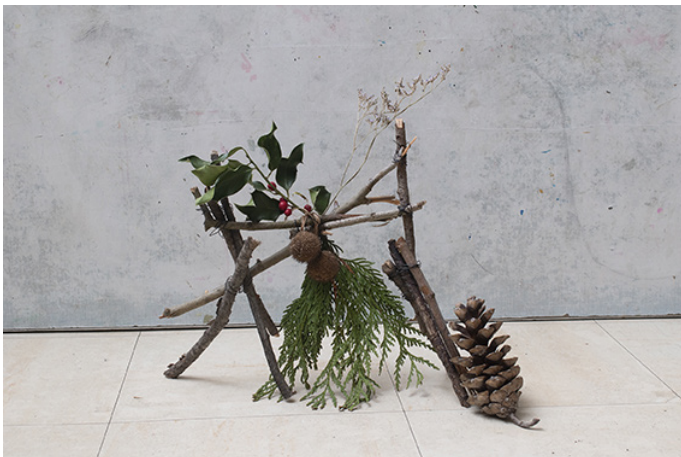
© Ecole élémentaire Bertly Albrecht, CM2, Fresnes

Depuis 2015, il prend une part active dans la transmission et la pédagogie en tant qu'artiste intervenant, dans différentes institutions comme la Maison Doisneau, Le Lavoir Numérique et le Cneai.