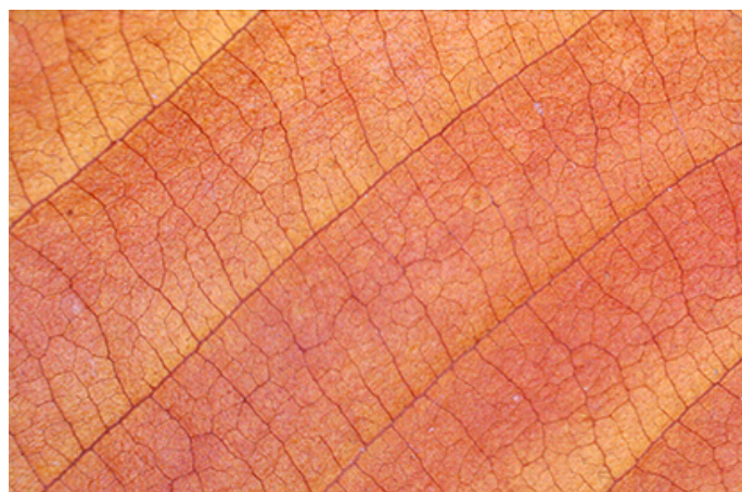
© Ecole élémentaire Barbara, CE1/CE2, Fresnes

création mais également autour de commandes pour la presse (le Monde, Télérama, Libération) et de commandes publiques. Ainsi, elle réalise en 2021 l'œuvre Forêt Métropolitaine, acquise par le Fonds National d'Art Contemporain, dans le cadre des Regards du Grand Paris ou encore Grandeur Nature, projet réalisé en 2023 grâce au fonds de dotation du Grand Paris Express avec le soutien de la Métropole du Grand Paris et de l'association COAL. Lauréate du soutien à la photographie documentaire du Centre National des Arts Plastiques en 2022, Alexandra Serrano travaille actuellement sur un projet qui retrace l'exil collectif de républicains espagnols depuis la France vers le Mexique entre 1937 et 1940.