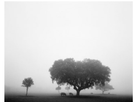
Zemplén, Hongrie, 1979 Pentti Sammallahti / Courtesy galerie Camera Obscura