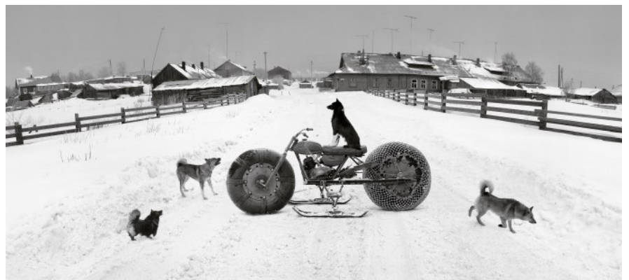
Solovki, mer Blanche, Russie, 1992.