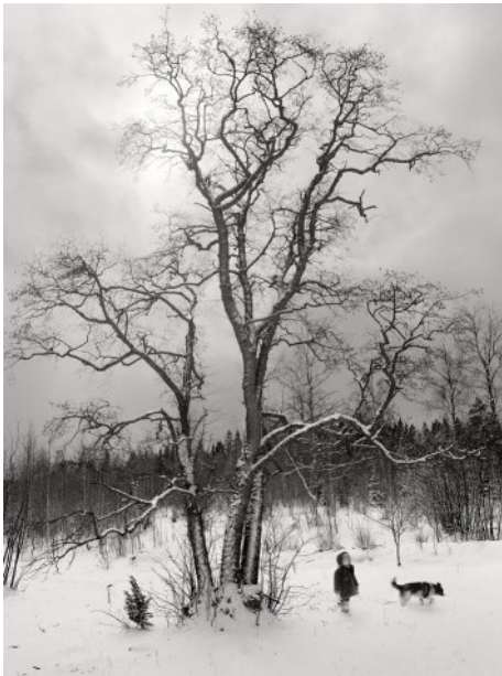
Helsinki, Finlande, 1983